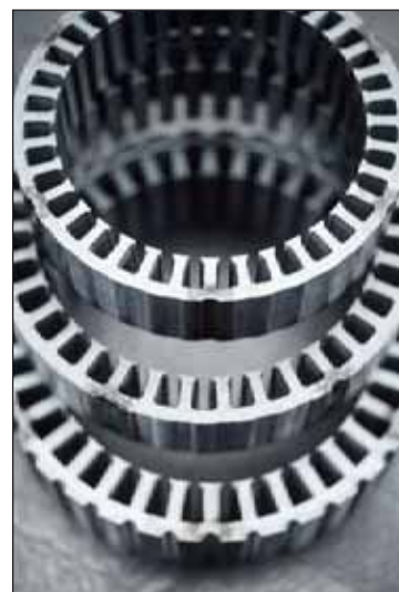
Soudage plasma déconfiné d'empilages magnétiques.